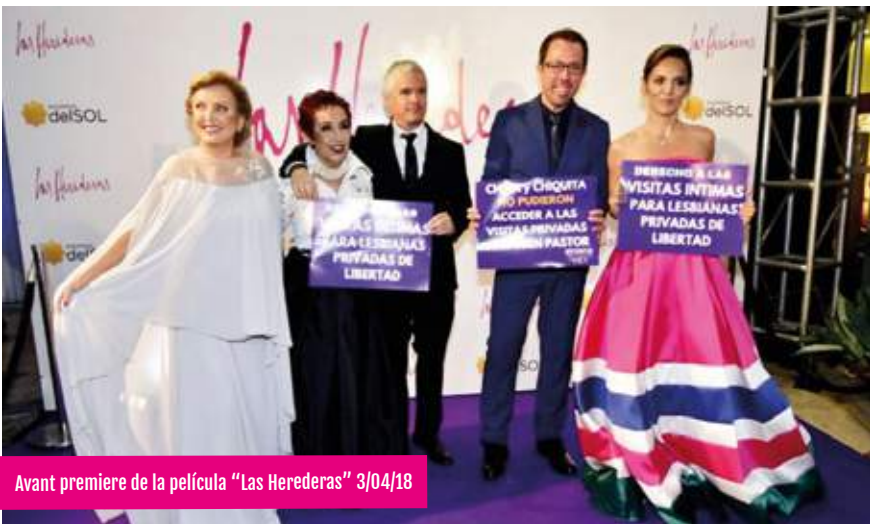
Avant premiere de la película “Las Herederas” 3/04/18